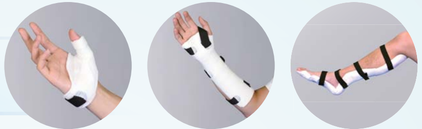
※使用画像はイメージです。 ※面ファスナーは取扱っていません。